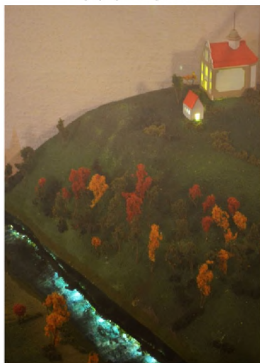
Kaplica św. Floriana, domek pustelnika, w dole oczywiście Nysa Kłodzka (makieta na podstawie XVIII-wiecznej ryciny, do obejrzenia na wystawie w Bramie Wodnej).

Całą trasę można pokonać ulicami, drogami polnymi, alejkami parkowymi, ścieżkami lub schodami. Proszę nie używać torowiska kolejowego (trzeba je tylko przekroczyć między PK 3 a PK 4 – pamiętając, że pierwszeństwo mają tam pociągi). Kolejność odwiedzania PK jest dowolna, ale ich numeracja sugeruje wariant trasy najkrótszy i pozbawiony przeszkód terenowych. Pieszko będzie najłatwiej, ale można też użyć pojazdu nie emitującego spalin ani hałasu. Między PK 7 a PK 8 proszę nie korzystać ze skrótów (wystarczy drożnia). Między PK 13 a PK 14 najlepiej skorzystać ze schodów.